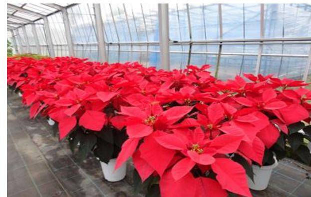
園芸科・温室のポインセチア