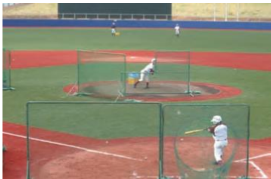
野球部活動の様子