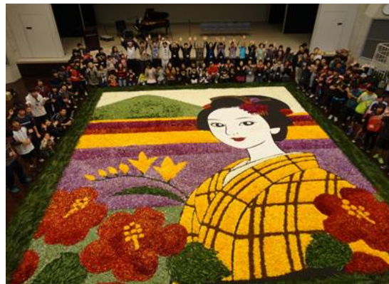
インフィオーラータ生徒参加の様子