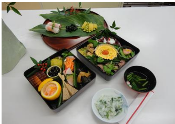
家政科制作のおせち料理