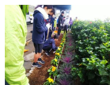
八丈島空港植栽ボランティア