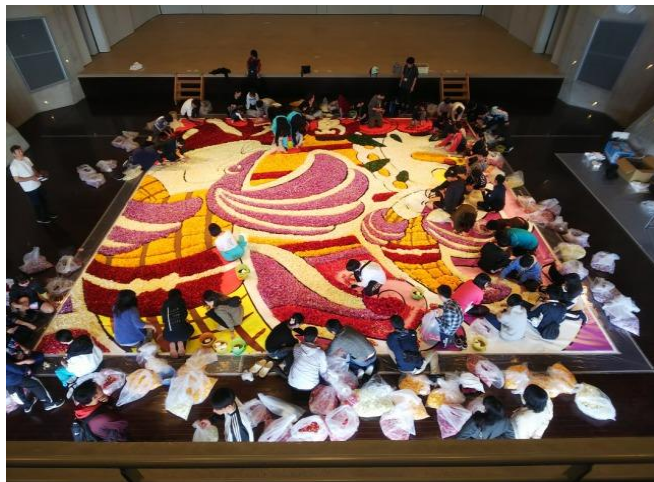
生徒ボランティアによるフリージアインフィオラータ参加