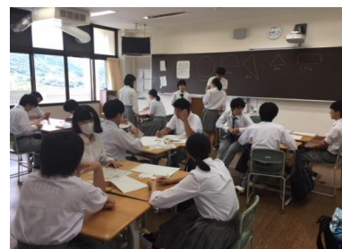
わかる授業から学びたくなる授業へ