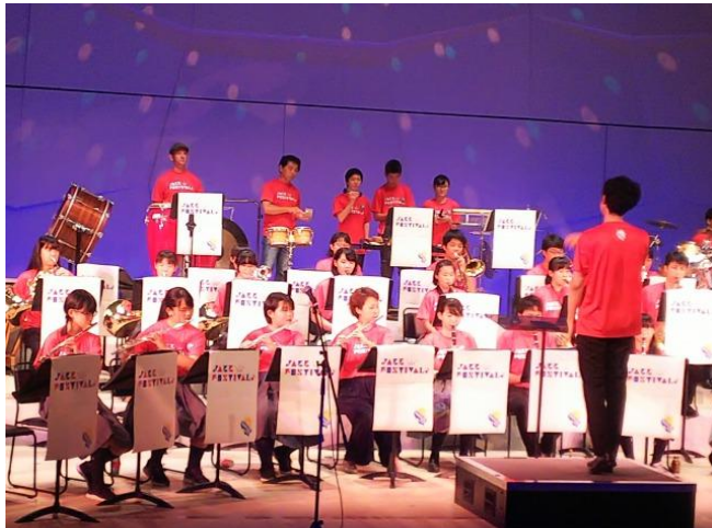
地域文化プログラムへの共同参画