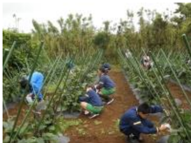
園芸科の作業の様子