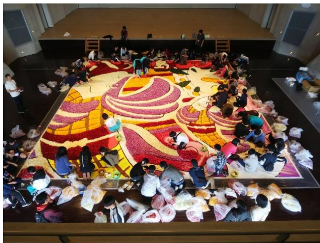
生徒ボランティアによるフリージアインフィオラータ参加