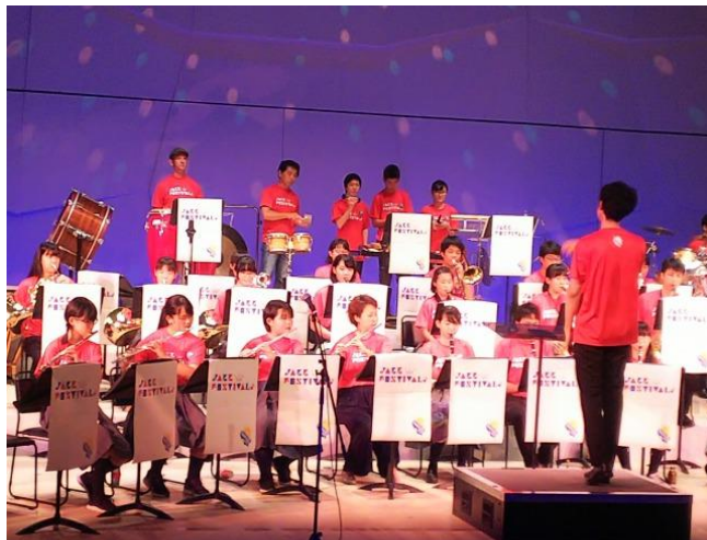
地域文化プログラムへの共同参画