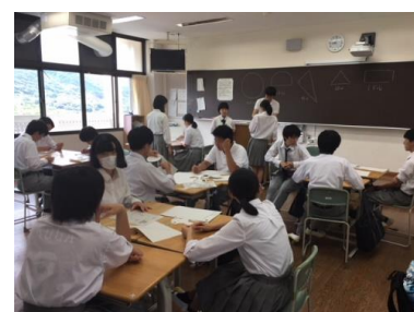
わかる授業から学びたくなる授業へ