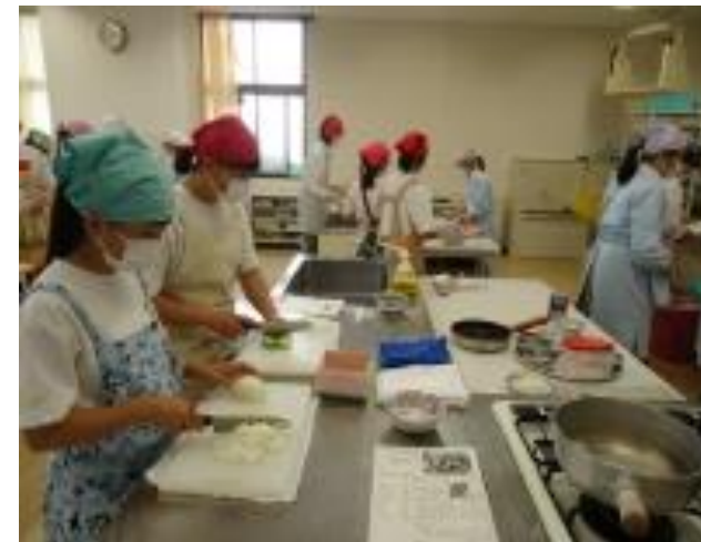
家政科の郷土料理づくり