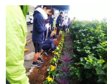
八丈島空港植栽ボランティア