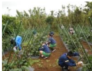
園芸科の作業の様子