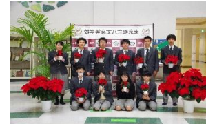
八高生の育てたポインセチアを東京都へ寄贈