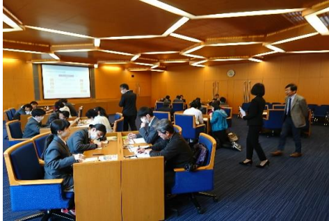
八丈町の今後の10年の施策検討の様子