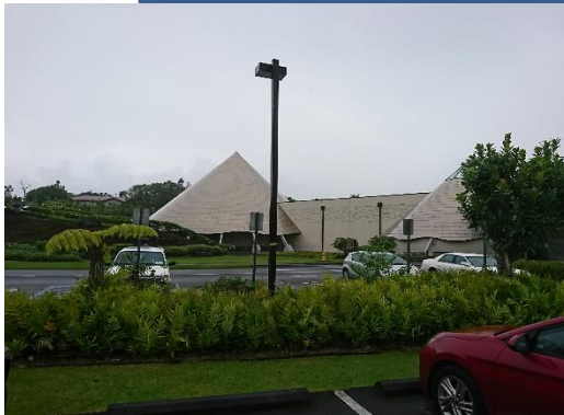
ハワイ大学ヒロ校プラネタリウム及びカフェテリア棟