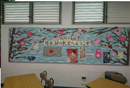
Waiakea高校の日本語教室