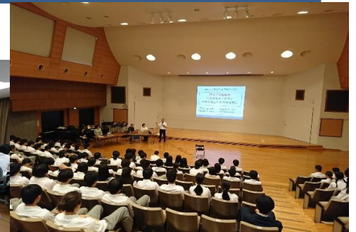
都立大学教授との連携授業の様子