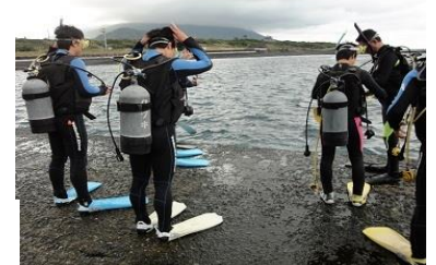
海洋文化の授業の様子